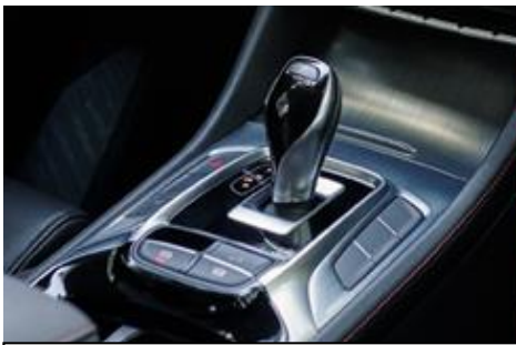
7-stupanjski automatski DCT mjenjač kao opcija na Comfort i Luxury