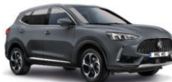
MAGIC siva (novo)