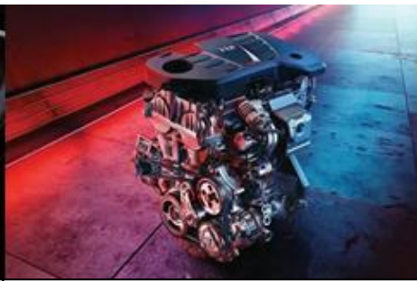
Snažan motor 1.5T GDI s izravnim ubrizgavanjem goriva osigurava snagu od 162 KS