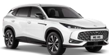
PEARL bijela Bez naknade