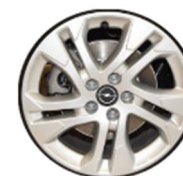
DZHXL 17-inčni aluminijski naplatak, AGILIS