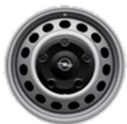
16/17-inčni čelični naplatci standardno