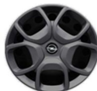
DZHYY 17-inčni naplatak, PRIMACY (dostupno samo uz pakete DPD22/47/69)