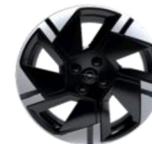
17" aluminijski naplatci "Ben Solo"