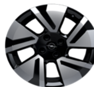
17" aluminijski naplatci "Groot"