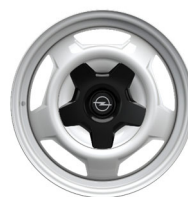
16" čelični bijeli naplatci (obavezni sa DJD05)