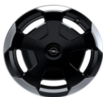
16" čelični naplatci "Captain"(Edition)