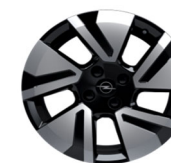
17" aluminijski naplatci "Groot"(GS)