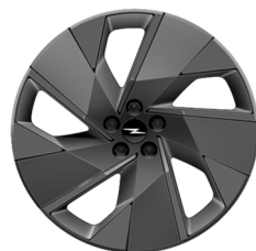
19" aluminijски naplatci u antracit boji (Edition serija)