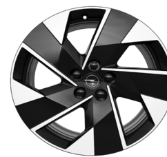
19" aluminijски naplatci Diamond Cut (GS i Ultimate serija)